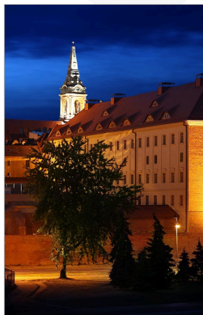
Hotel Bulwar. Widok z mostu

Wydział Prawa i Administracji UMK ul. Gagarina 15, 87-100 Toruń