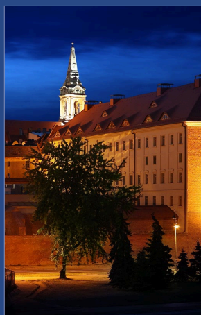
Hotel Bulwar. Widok z mostu

Wydział Prawa i Administracji UMK ul. Gagarina 15, 87-100 Toruń