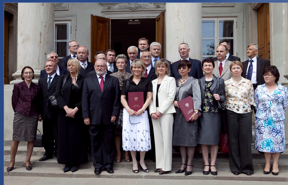
PKW oraz przedstawiciele KBW i OKW nr 4 i 5 wraz z Pierwszym Prezesem SN. Ogłoszenie wyników wyborów do Parlamentu Europejskiego w 2009 roku