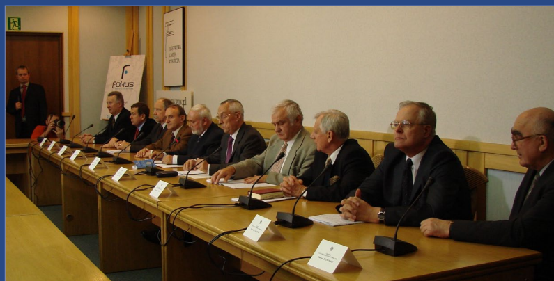
Państwowa Komisja Wyborcza. Ogłoszenie wyników wyborów samorządowych w 2006 roku

Państwowej Komisji Wyborczej. Dla obsługi innych organów wyborczych powołano natomiast – jako instytucje stałe – wojewódzkie biura wyborcze, przekształcone następnie w delegatury Krajowego Biura Wyborczego.