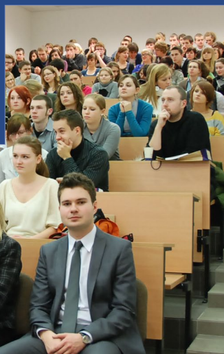
Spotkanie ekspertów prawa wyborczego z toruńskimi licealistami pt. „Wyborczy pierwszy raz” w lutym 2010 roku